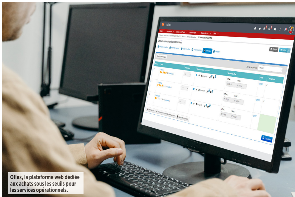
Oflex, la plateforme web dédiée aux achats sous les seuils pour les services opérationnels.

* Loi ASAP : loi d'accélération et de simplification de l'action publique.